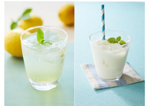
(写真左：砂糖無添加 シチリアンレモネード黒酢 炭酸割)

(*1)1杯30ml(4倍希釈時120ml)あたり(*2)希望小売価格(税別)換算